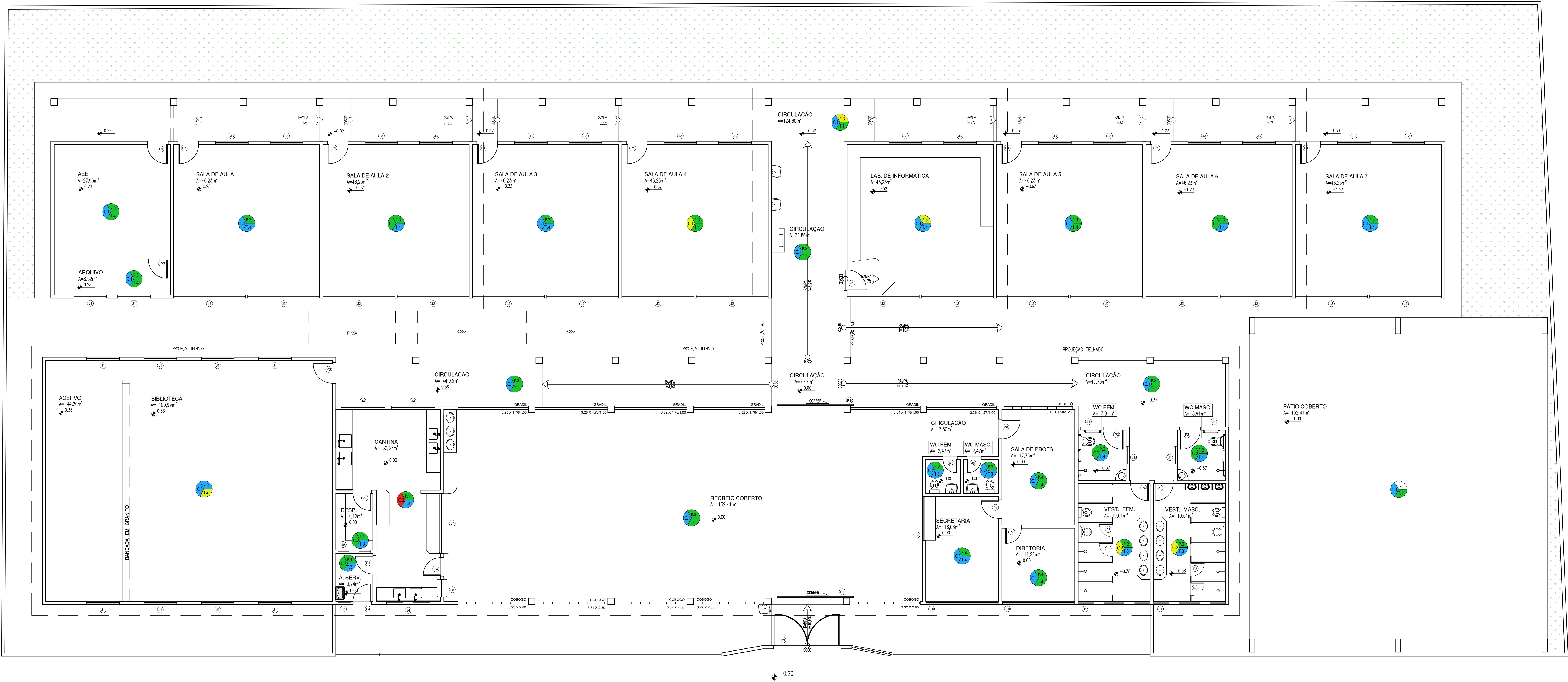
01 PLANTA BAIXA - ESTADO ATUAL

COR PRMA 01 02 03 04 05 06 07 08 09 10 11 12 13 14 15 16 17 18 19 20 21 22 23 24 25 26 27 28 29 30 31 32 33 34 35 36 37 38 39 40 41 42 43 44 45 46 47 48 49 50 51 52 53 54 55 56 57 58 59 60 61 62 63 64 65 66 67 68 69 70 71 72 73 74 75 76 77 78 79 80 81 82 83 84 85 86 87 88 89 90 91 92 93 94 95 96 97 98 99 100